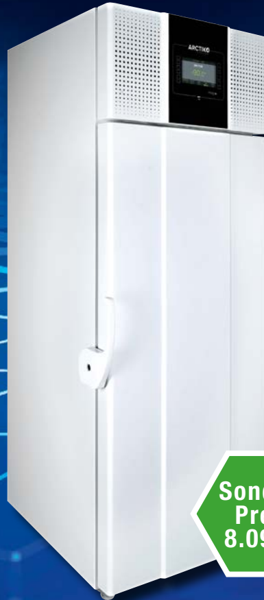
Arctiko ULUF P390GG* Dual Cool Kühlsystem