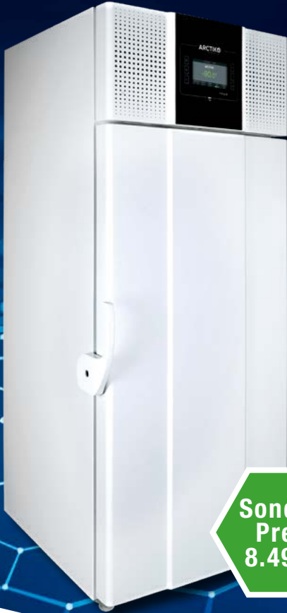
Arctiko ULUF P500GG* Dual Cool Kühlsystem